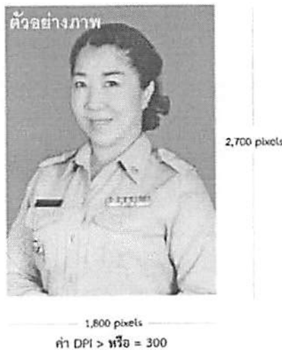
ตัวอย่างภาพถ่ายชุดข้าราชการสีกากี (แขนยาว)

ข้าราชการ และลูกจ้างประจำดีเด่น ประจำปี ๒๕๖๒ จัดส่งภาพถ่ายปัจจุบัน ชุดข้าราชการสีกากี (แขนยาว) คนละ ๑ รูป (รายละเอียดตามตัวอย่าง) โดยให้แจ้งชื่อเจ้าของภาพถ่าย และแนบไฟล์ส่ง Email : personelcdd@gmail.com เพื่อจัดทำหนังสือที่ระลึก “คุณคือ ความภาคภูมิใจของคน พช.” และจัดทำนิตรศการ ภายในวันที่ ๑๖ สิงหาคม ๒๕๖๒