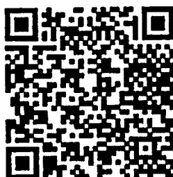
Barcode สำหรับตรวจสอบ**