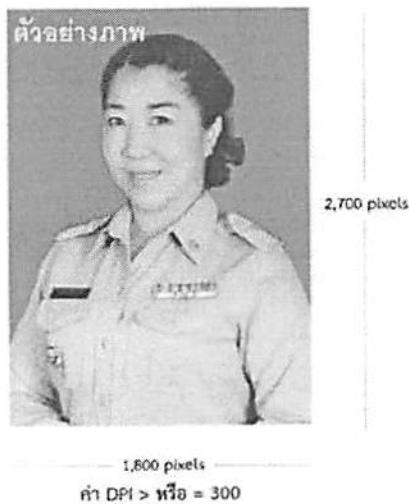
ตัวอย่างภาพถ่ายชุดข้าราชการสีกากี (แขนยาว)

ข้าราชการ และลูกจ้างประจำดีเด่น ประจำปี ๒๕๖๒ จัดส่งภาพถ่ายปัจจุบัน ชุดข้าราชการสีกากี (แขนยาว) คนละ ๑ รูป (รายละเอียดตามตัวอย่าง) โดยให้แจ้งชื่อเจ้าของภาพถ่าย และแนบไฟล์ส่ง Email : personelcdd@gmail.com เพื่อจัดทำหนังสือที่ระลึก “คุณคือ ความภาคภูมิใจของคน พช.” และจัดทำนิตรศการ ภายในวันที่ ๑๖ สิงหาคม ๒๕๖๒