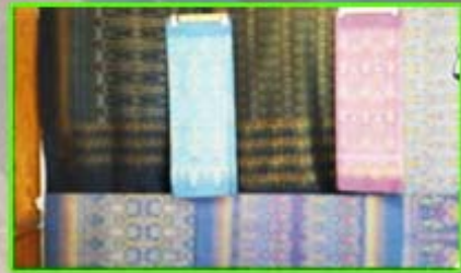
ผ้าไหมมัดหมี่