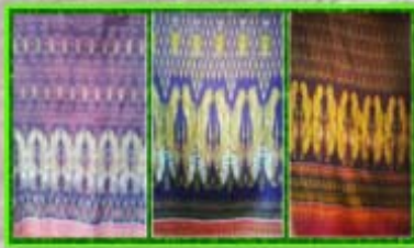
ผ้าไหมมัดหมี่ข้อมนางง