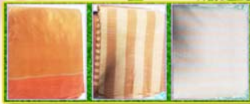
ผ้าทออ้อมี ราคา เมตรละ 200 บาท