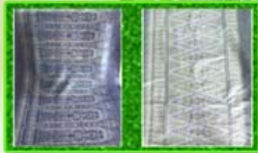
ผ้าไหมมัดหมี่ 3 ตะกรง