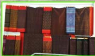
ผ้าไหมมัดหมี่ตีบนแดง